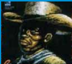
Illustration d'une légende du pays djerma au Niger. Au royaume du roi Koda, despote farouche et cruel, habite un brave pêcheur dénommé « Doigt de Dieu ». Afin d'éprouver sa vertu, le Roi Koda lui confie la bague qu'il porte au doigt avec mission de la lui rendre au bout d'un an. Si « Doigt de Dieu » n'est pas en mesure de restituer la bague, il aura la tête tranchée. Malgré la trahison de sa femme, le pêcheur triomphe de l'épreuve et conquiert l'estime du roi.